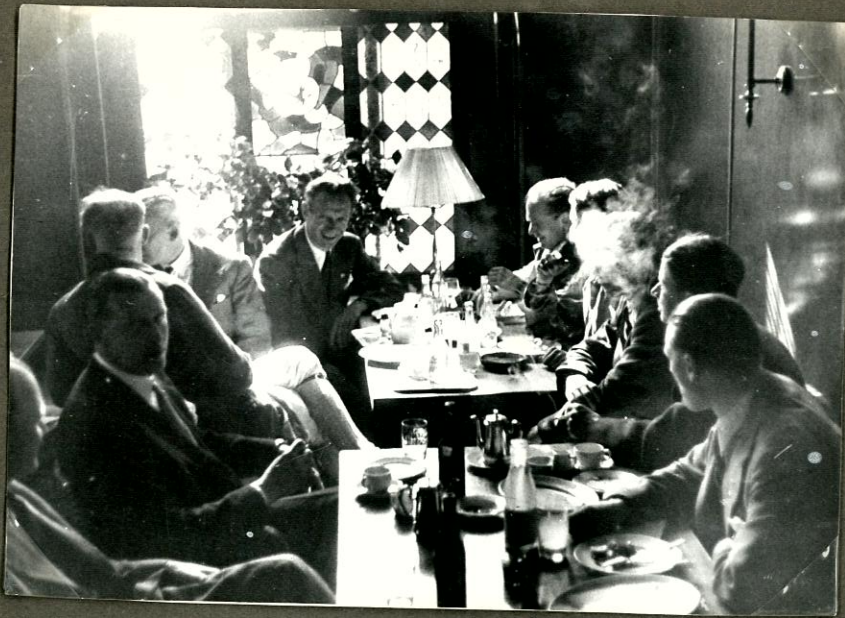
Sportskroen var et koselig samlingssted mellem kampene. -