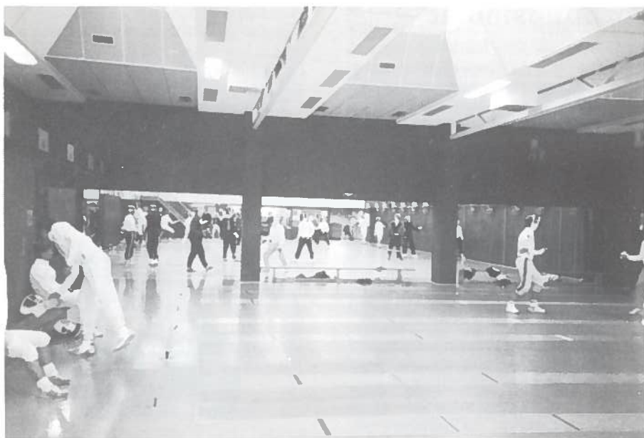
Fäktsalen i TBB med 32 inbyggda metallpister.